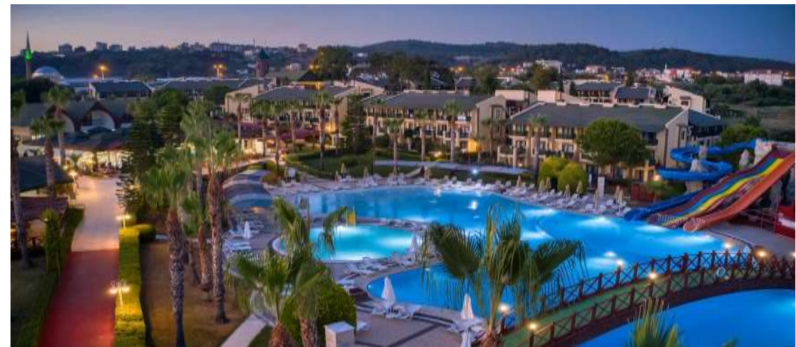
Oz Hotels Incekum Beach Resort