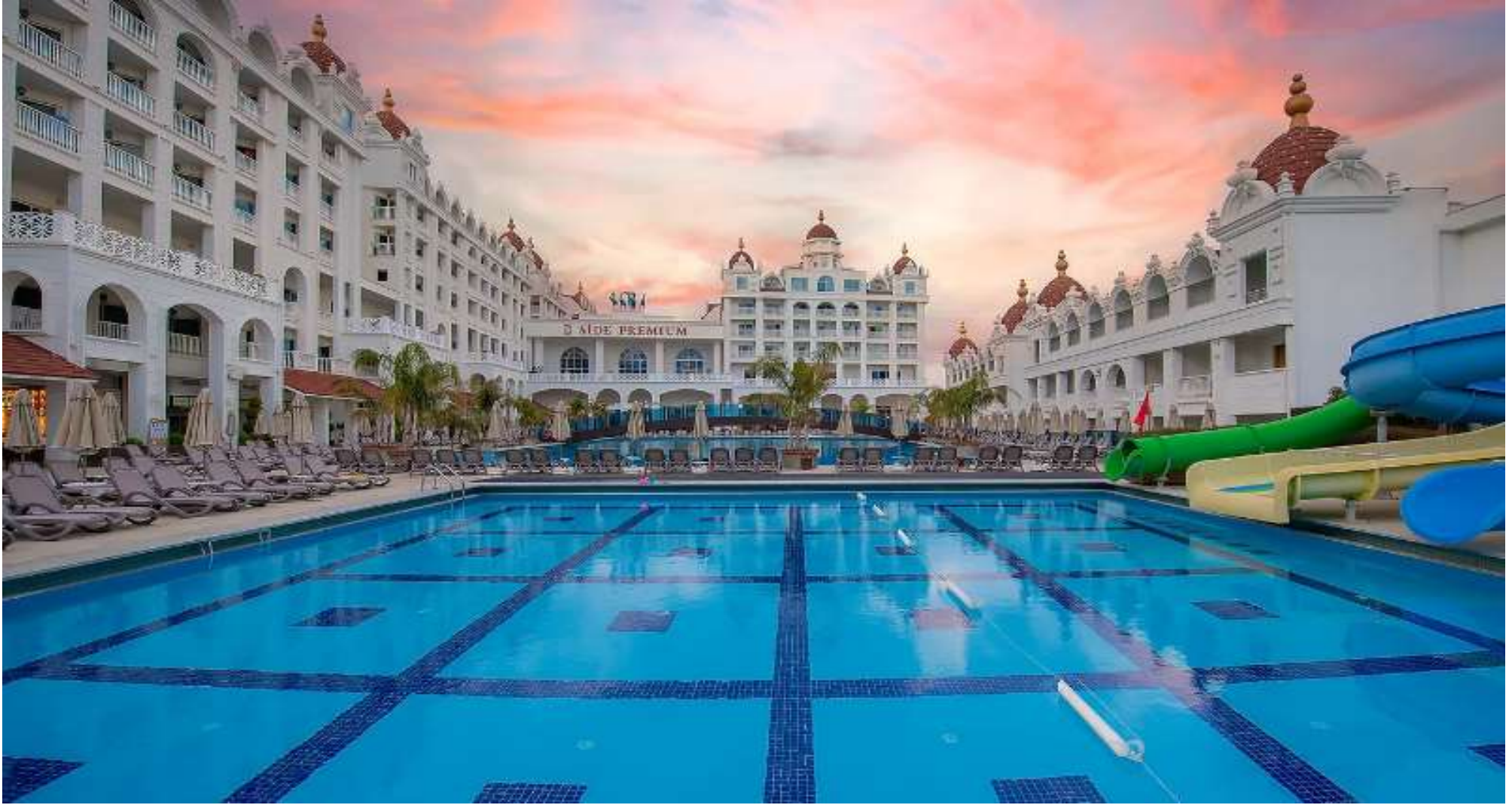
ÖZ HOTELS SIDE PREMIUM EVRENSEKİ,ANTALYA