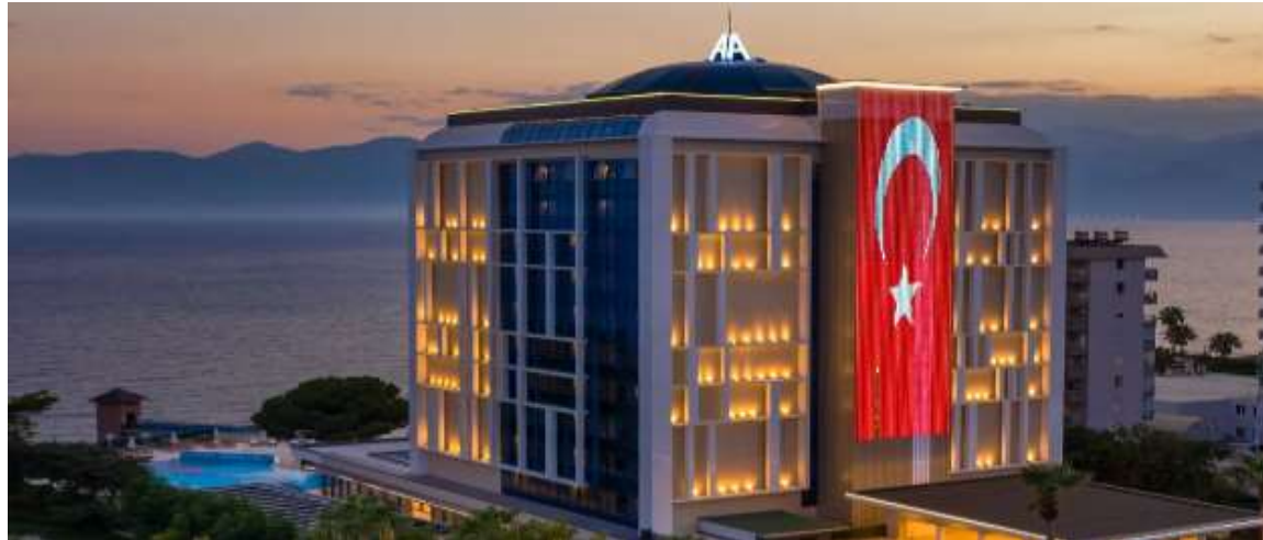
Oz Hotels Antalya Resort & Spa