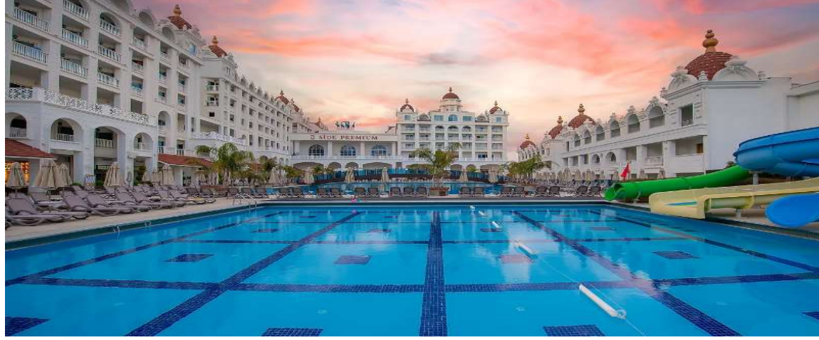
Oz Hotels Side Premium