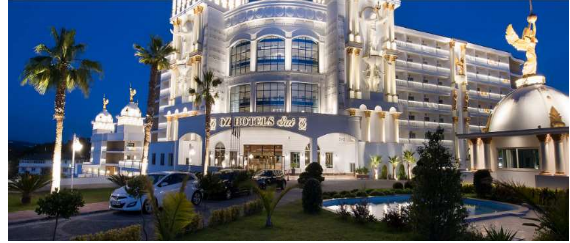
Oz Hotels Sui Resort